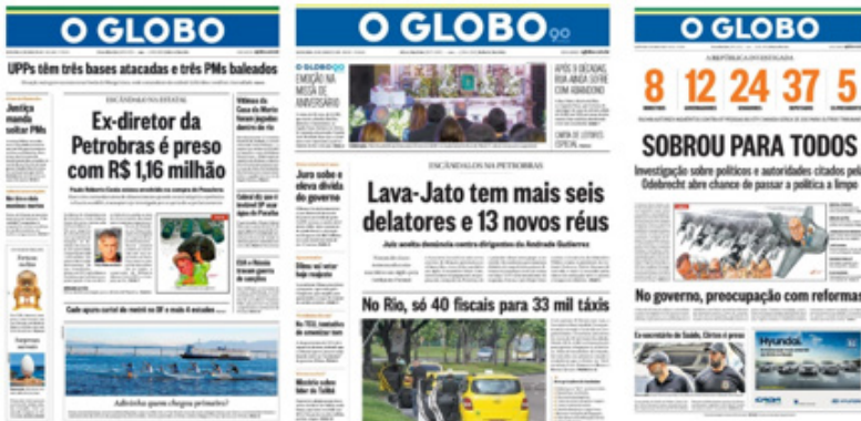
Figura 5, 6 e 7 – Sequência sobre Lava-Jato, da esquerda para direita: 21/03/2014; 30/07/2015; 12/04/2017