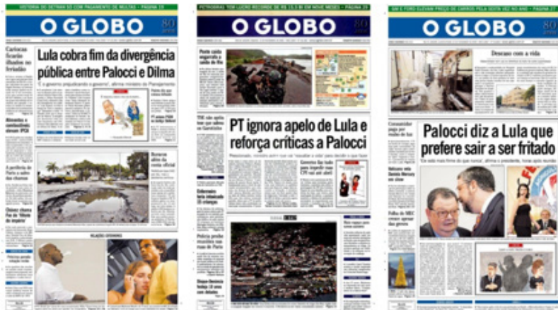
Figuras 11, 12 e 13 – 11, 12 e 23 de novembro de 2005

o envolvendo estava sempre à espreita: a de sua divergência com a então chefe da Casa Civil Dilma Rousseff. O motivo da diferença entre os dois era a condução da política econômica do governo, e nada tinha a ver com o processo de investigação no qual Palocci estava envolvido.