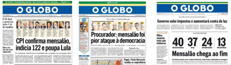
Figura 2, 3 e 4 – O Mensalão ao longo dos anos, da esquerda para direita: 30/03/2006; 09/07/2011; 14/03/2014

anos, obviamente, outros escândalos menores ocuparam as páginas do jornal, mas nenhum com o destaque obtido pelo Mensalão. Afinal, ele foi o responsável por minar a continuidade política de figuras que estavam no centro do poder.