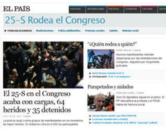
Figura 2 Capa da seção criada para a cobertura do “25S” na página eletrônica do El País